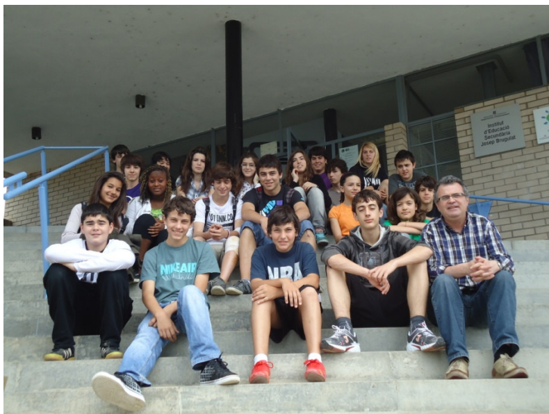
Parlamentaris i parlamentàries en el dia de dissolució del Parlament acompanyats per en Miquel de les Escoles Sostenibles

El Parlament anomenarà diferents comissions parlamentàries els objectiu de les quals seran diversos: pel control de la bona separació de residus, control de la temperatura de les aules, indicació dels diferents cartells del Parlament ... Així d'aquesta manera serà més operatiu i resolutiu.