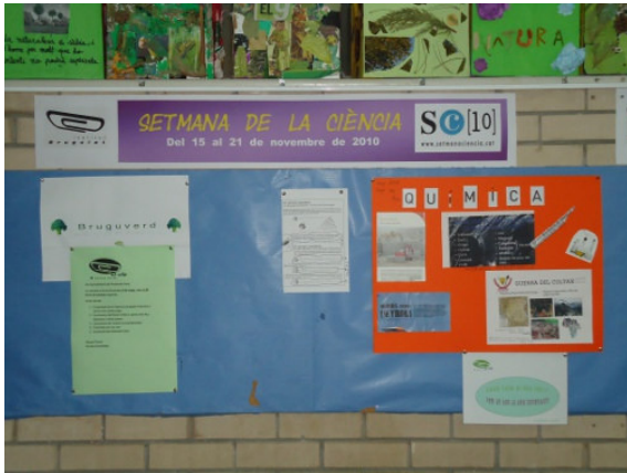
Cartellera Verda informativa

Les Cartelleres Verdes informatives, són un espai per a la divulgació de notícies o esdeveniments relacionats amb el medi i la sostenibilitat. Periòdicament es van renovant, aportant nous coneixements i fent divulgació d'allò que ens pot interessar. Recomanem la seva consulta periòdica. Aquesta cartellera està situada en la planta principal, baixant del primer pis.